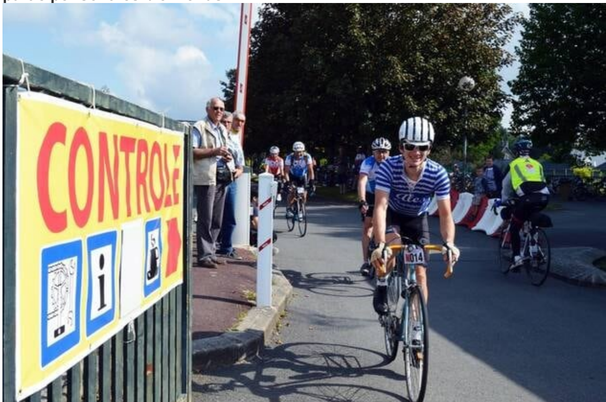
Des participants du Paris-Brest-Paris en août 2019, à Fougères.