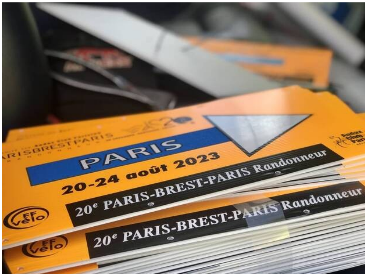
Des pancartes de la randonnée cycliste Paris-Brest-Paris.

Près de 7 000 cyclistes partis de Paris, ce dimanche 20 août, passeront par l'itinéraire jusqu'à Fougères et le lycée Guéhenno, étape de repos et de contrôle , avant de poursuivre leur route direction Brest. Puis ils repasseront un ou deux jours après, dans l'autre sens.